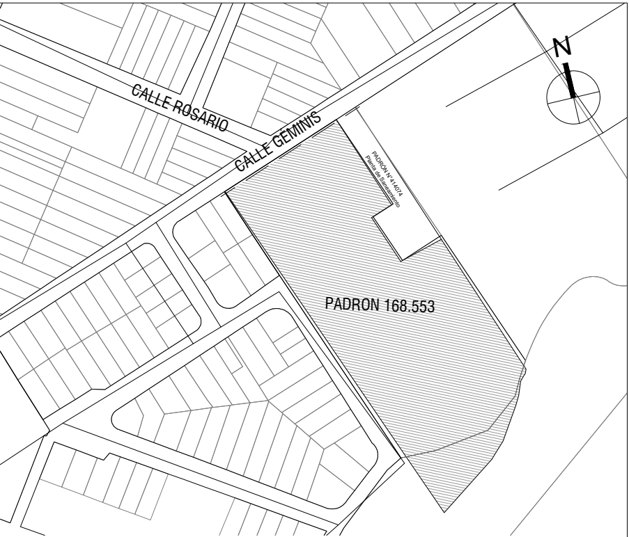
PLANO DE UBICACIÓN escala 1/4000

Se mueve puerta de lugar y se coloca una corrediza